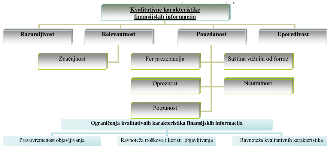
Slika 1. Kvalitativne karakteristike finansijskih informacija prema Okviru

Između više kvalitativnih karakteristika finansijskih informacija navedenih u Okviru, kao četiri najvažnije ističu se: razumljivost, relevantnost, pouzdanost i uporedivost, a njihova veza sa ostalim kvalitativnim karakteristikama i ograničenjima ispunjenja istih, ilustrovana je na slici 1.