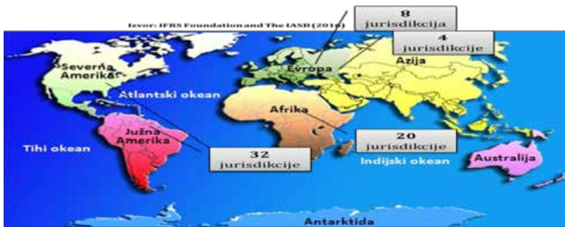
Slika 2: Primjena MSFI za MMSP po jurisdikcijama

primjenu MSFI za MSP. Najrazvijenije zemlje svijeta (Amerika, Rusija, Kina, Japan, Indija, Turska, zemlje članice EU itd.) nijesu prihvatile MSFI za MSP. Na slici koja slijedi se daje prikaz broja jurisdikcija koje su po pojedinim kontinentima koje zahtijevaju ili dozvoljavaju primjenu MSFI za MMSP (Zvanični podaci IFRS iz avgusta 2016) (slika 2)