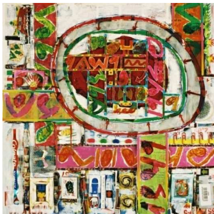
Slika 4. Nusret Pašić, Bez naziva , 2005, kombinovana tehnika upotreba tzv. dekorativnog PVA ljepila i akrilne emulzije

toliko specijalizovani, da se misli i o čišćenju alata, o tačno potrebnoj otvorenoj fazi, o obojenosti ljepila, o tačno potrebnoj gustoći i konzistenciji, itd.... Koliko daleko ide usavršavanje karakteristika namjenskih ljepila, govore podaci o proizvodnji specijalizovanih ljepila kao ljepila otporna na otapala i ulja, fleksibilna ljepila, ljepila koja provode struju, ljepila koja podnose iznimno visoke temperature, ljepila koja se stvrđnu pod utjecajem ultravioletnog (UV) zračenja, ljepila koja sprječavaju klizanje, itd, zapravo namijenjena po svakom osnovu za datu situaciju u kojoj će se naći.