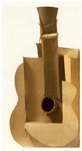
Slika 2. Pablo Picasso, Maketa za gitaru , 1912, karton, žica i konopac, 66.1 x 33.19 cm lijepjenje škrobnim ljepilom