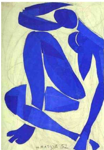
Slika 1. Henri Matisse, Plavi akt III , 1952., 174 x 80.6 cm kolažirani gvaš (rezane bojene plohe lijepjene tutkalom na papirni nosilac)

potpuno završi. Smanjuje se volumen i do 90% kada voda ispari. U svrhu kolažiranja se u zadnje vrijeme koriste i tzv. tapetna ljepila , koja su isto na bazi metilceluloze.