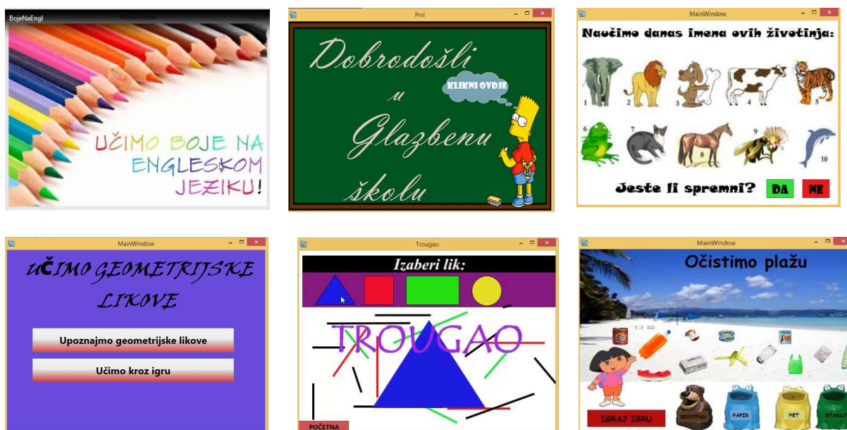
Slika 4. Različite obrazovne aplikacije

Za djecu ranog školskog uzrasta razvijene su aplikacije koje im mogu pomoći da kroz igru vrlo lako nauče tablicu množenja, osnovne geometrijske oblike i važne formule iz matematike, osnovne zakone fizike i još puno toga.