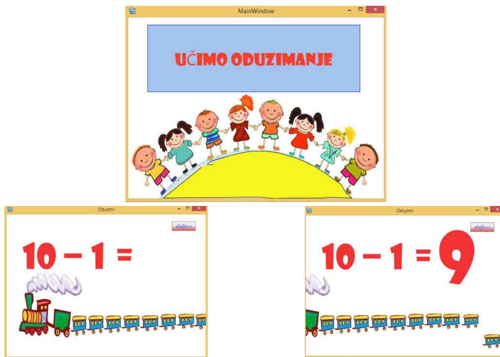
Slika 3. Oduzimanje do broja 10