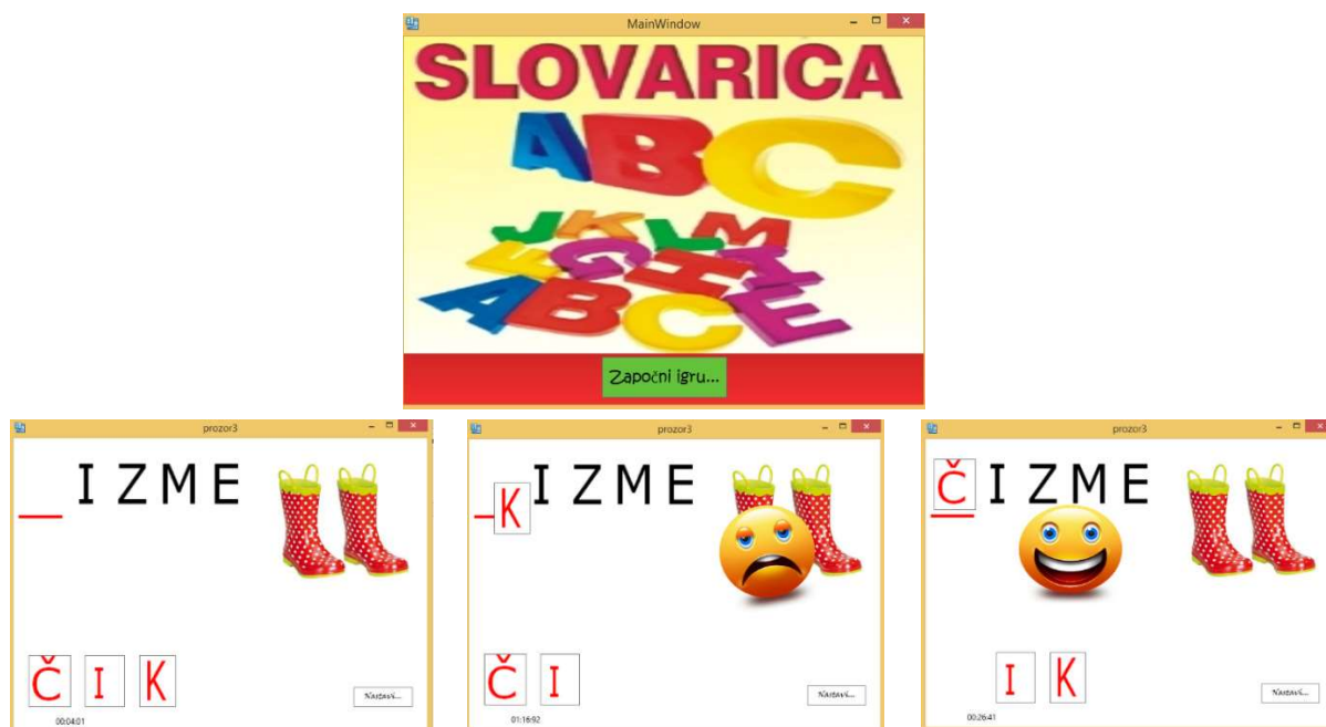
Slika 1. Slovarica