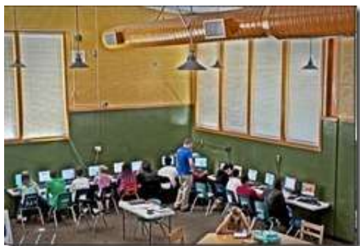
Slika 2. Učionica budućnosti