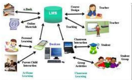
Slika 3. Uloga nastavnika u alternativnim školama

U alternativnim školama vrši se stimuliranje učenika na slobodno izražavanje, projektiranje, razvija se individualnost ali i kreativnost. U ovim školama dosta se radi na razvijanju samostalnosti i skrivenih mogućnosti učenika. Nastava je u alternativnim školama temeljni oblik organizacije škole. U ovim školama postoje slobodne aktivnosti učenika gdje izražavaju svoje talente, formiraju se udruženja, uglavnom radi se na formiranju zajedničkog života i rada u školi, kako nastavnika tako i učenika (Đorđević, 1981). Zadovoljenje individualnih potreba učenika omogućeno je različitim sadržajima, stalnim obrazovnim aktivnostima, primjenom različitih oblika i metoda u nastavi, a sve s jednim ciljem osposobiti učenika za samostalan život.