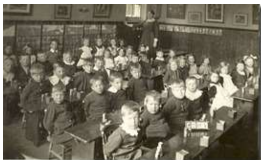
Slika 1. Učionica prošlosti

učenja ne treba insistirati na isticanju onog što je najbolje, nego onoga što određenoj grupi odgovara. Savremena nastava teži na tome da se cjelokupni nastavni proces usmjeri na učenika. Nastavnik iz svoje uloge predavača prelazi u ulogu organizatora, mentora. Planiranje i programiranje odgojno - obrazovnog procesa stavlja se u kontekst kurikulumu pri tome uvažavajući sve njegove prednosti. Mediji su inovacija, koja veoma dobro došla u nastavnom procesu, pomoću tih inovacija, učenici veoma dobro usvajaju nastavne sadržaje.